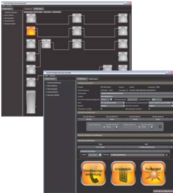
Einfaches Konfigurieren auch komplexer Anwendungen

Optional lässt sich die Zentrale für besondere Anwendungen mit erhöhtem Notstrombedarf um ein zusätzliches Netzteil erweitern, das in einem separaten Gehäuse an der Zentralenunterseite angeflanscht wird. Hierdurch erhöht sich die max. Batteriekapazität auf ca. 40 Ah.